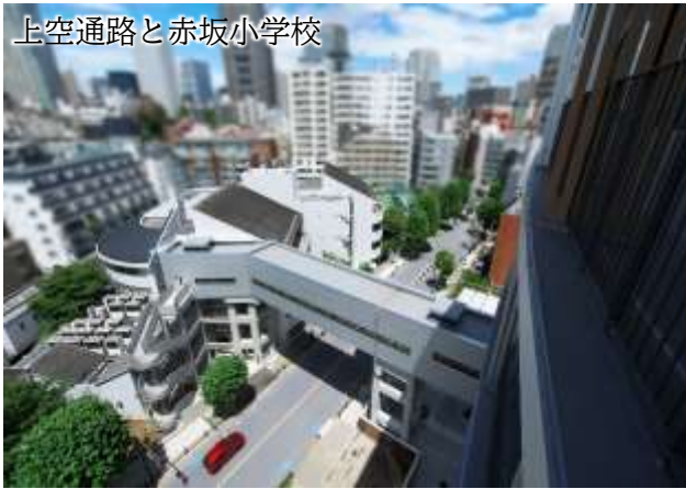
上空通路と赤坂小学校