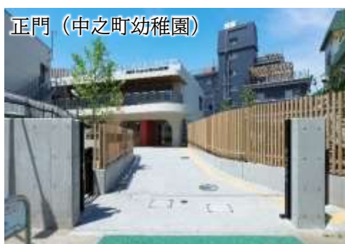
正門（中之町幼稚園）