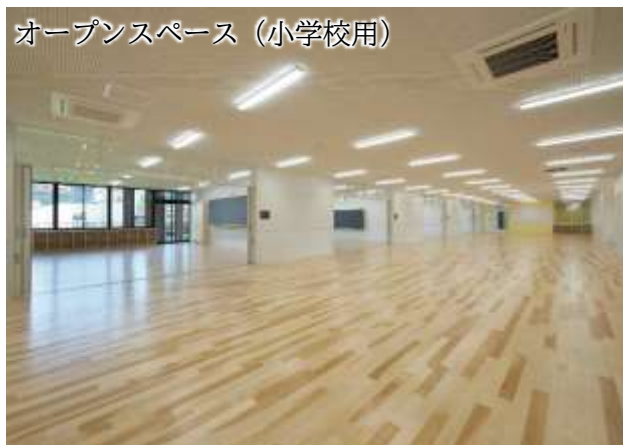
オープンスペース（小学校用）