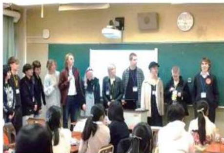
都立高校での授業参加体験・グループディスカッション