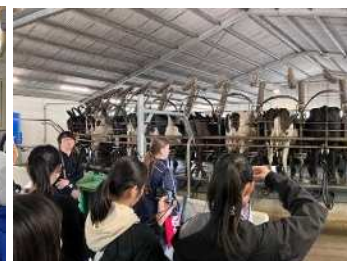
ニュージーランド