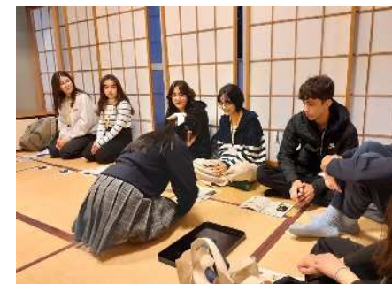
日本文化体験（弓道・茶道）