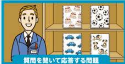
質問を聞いて応答する問題