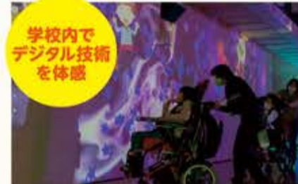
学校内で デジタル技術 を体感