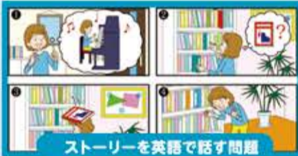
ストーリーを英語で話す問題

※著作権法で許容される範囲を超えて、掲載内容を無断でコピー、転載などの行為は違法であり、これを固く禁じます。