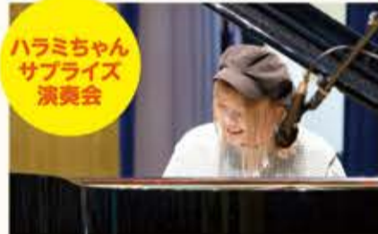
ハラミちゃん サプライズ 演奏会