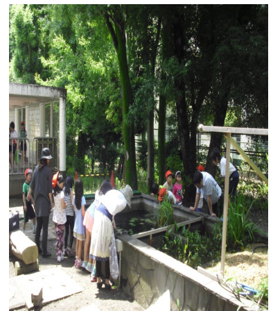
ビオトープ開放の様子