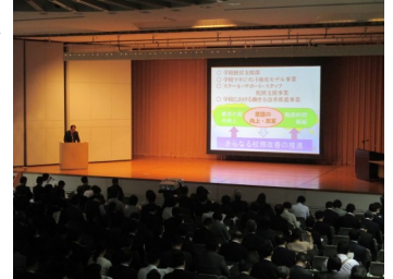
当日の会場の様子

校務改善のホームページ（下部参照）には、発表校の全スライドや当日の資料、アンケート結果の詳細などを掲載。さらに、スクール・サポート・スタッフ活用事例集は当日配布した資料よりページを増やした最新版を載せてあります。発表会に参加された方も、されてない方も御活用いただける資料となっております。是非御覧ください。