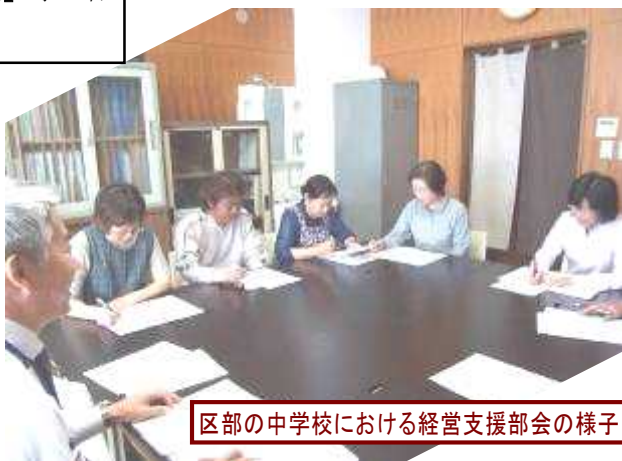
区部の中学校における経営支援部会の様子

上記要件を充たせば、組織の名称は学校ごとに決めることができます。今年度設置した学校のうち、多くは「経営支援部」「学校経営支援部」、「学校改善委員会」等の名称で校務改善を推進しています。