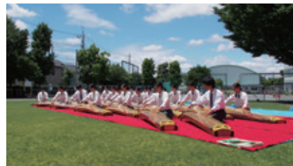
お琴とお抹茶をたのしみ会 (6/6開催) 都立狛江高校箏曲部や五小卒業生による琴の演奏を鑑賞しながら、芝生の上で抹茶を楽しむ会。