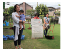
毎週担当のクラスを割り当て、活動後は芝生の上でレクリエーション等を行っています。