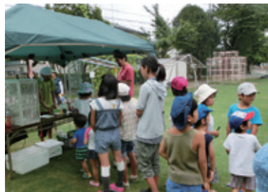
サマードリームデイ (8/8と8/15開催) 芝刈り作業後に、近所の商店街の方の御協力を得てかき氷をふるまいました。