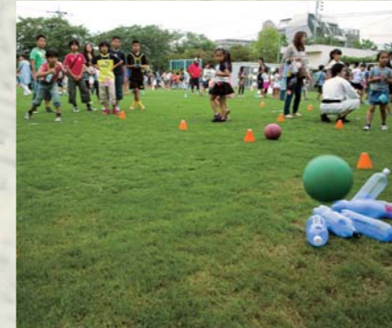
新宿まつりは手作りのゲーム、屋台がたくさん。夏の夕方のおたのしみ。

る方が多く、地域と学校との関わりが強い地域特性を持っており、学校行事などには卒業生でもある地域の方々から来訪し