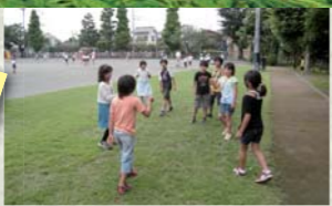
福生第二小学校の芝生