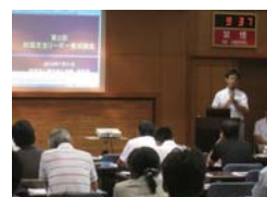
芝生を管理するノウハウ満載の講義

参加者は、様々な品種の感触の違いを手や足で触れるなど、実際に比較体験しながら講師へ熱心に質問し、リーダー養成講座にふさわしい、充実した講習会となりました。