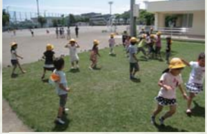
由木中央小学校の出前芝 マットのような芝を出前！