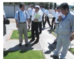
圃場を見学し、いろいろな芝の違いを体験