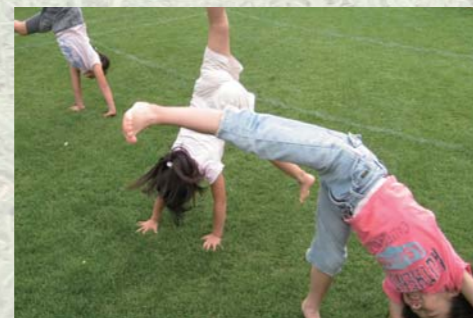
「転んでも痛くない！」 新しいことにチャレンジする意欲の源。 「やってみよう！」が「できた！」へ！ 児童の自信につながる第一歩です。