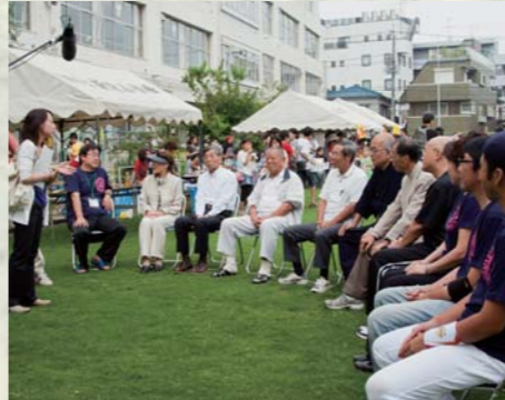
芝生車座集い。新宿小学校の校庭の芝生に関わることでとても楽しい、とみなさん口々に語っていただきました。

新宿小学校では芝生を活かした取り組みとして、全児童が体育朝会で芝生の上でゴロゴロ転がったり、「クモ歩き」という仰向けの四つん這いで歩く運動による体力向上の取組や、児童・保護者だけでなく、地域の参