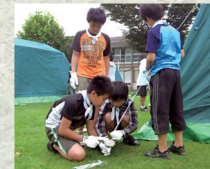
みんなの力でテントを立てます。協力してひとつの仕事をするのは楽しい！