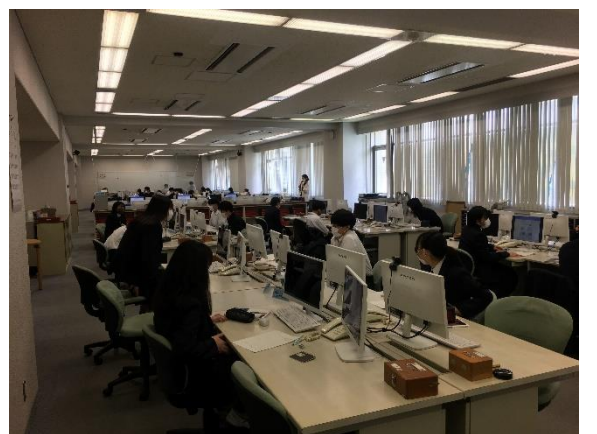
企業との連携授業もあります。