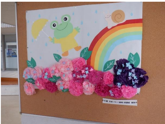
校内には生徒が作成した作品が展示してあります。