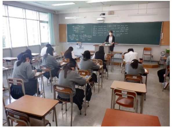
授業の様子（先生が基礎から丁寧に教えてくれます。）