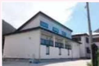
村営学生寮「しらすな寮」

寮では、掃除や洗濯などをはじめ、週末は当番制で食事を作るなどして生活しています。寮生全員での共同生活ですので、個人が規則正しい生活を送りながら、お互いに気持ち良い生活が送れるような配慮をしています。