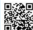
学校ホームページ

ボランティア活動の一貫として、今年度は小中高の合同で新島の浜清掃を行っています。