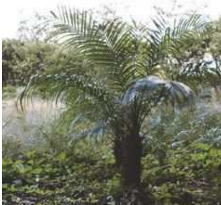
フェニックス・ロベレニー