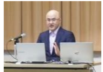
《令和3年度の開催》 「なぜ混むの？ ～渋滞の科学と解消方法」 実施日時：令和3年12月12日（日曜日） ※オンラインにて開催

募集に関する詳しい情報は、開催日の2か月前に各学校へ通知するとともに、東京都教育委員会ホームページでもお知らせします（会場での参集型の開催を予定しておりますが、新型コロナウイルスの感染状況によっては、オンライン開催に変更する場合があります。）。