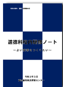
道徳科 校内研修ノート

道徳教育に関する17の項目について、校内研修で活用できる演習シートを掲載しています。