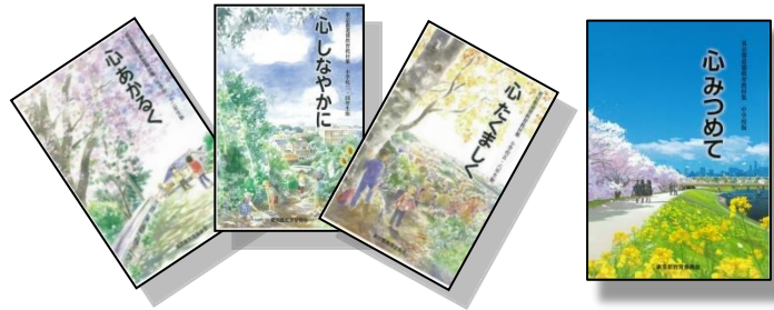
東京都道徳教育教材集 小学校版

学校と家庭とが一体となって取り組む道徳教育の充実に向け、東京都道徳教育教材集を是非御活用ください（教材集と併せて配布している「保護者用リーフレット」では、家庭での教材集の活用例などを紹介しています。）。