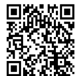
YouTubeチャンネル 二次元コード

就学前教育カンファレンス及び幼稚園教育研究協議会での実践発表や講演内容は、義務教育指導課のYouTubeチャンネルにて配信予定です。