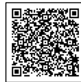
「学びの支援サイト」のページ