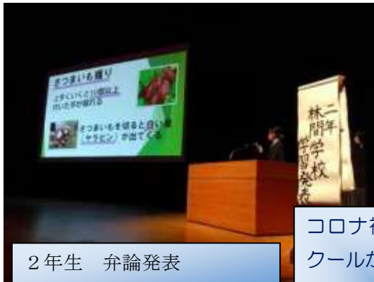
2年生 弁論発表 林間学校の体験発表