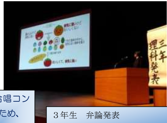
3年生 弁論発表 理科プレゼンテーション7