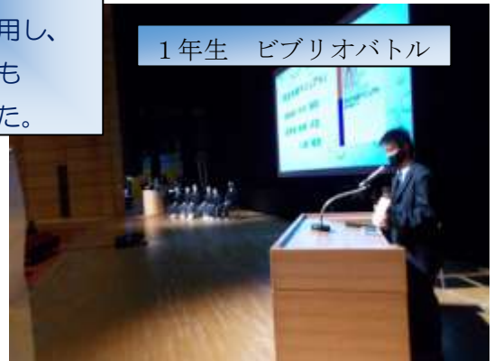
1年生 ビブリオバトル

コロナ禍により合唱コンクールができないため、日頃の学習成果を発表する行事に変更しました。区の大ホールを使用し、皆、緊張しながらも堂々と発表しました。