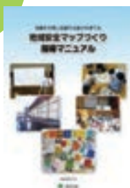
地域安全マップづくり 指導マニュアル