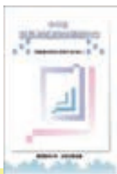
中学生自転車 交通安全利用DVD