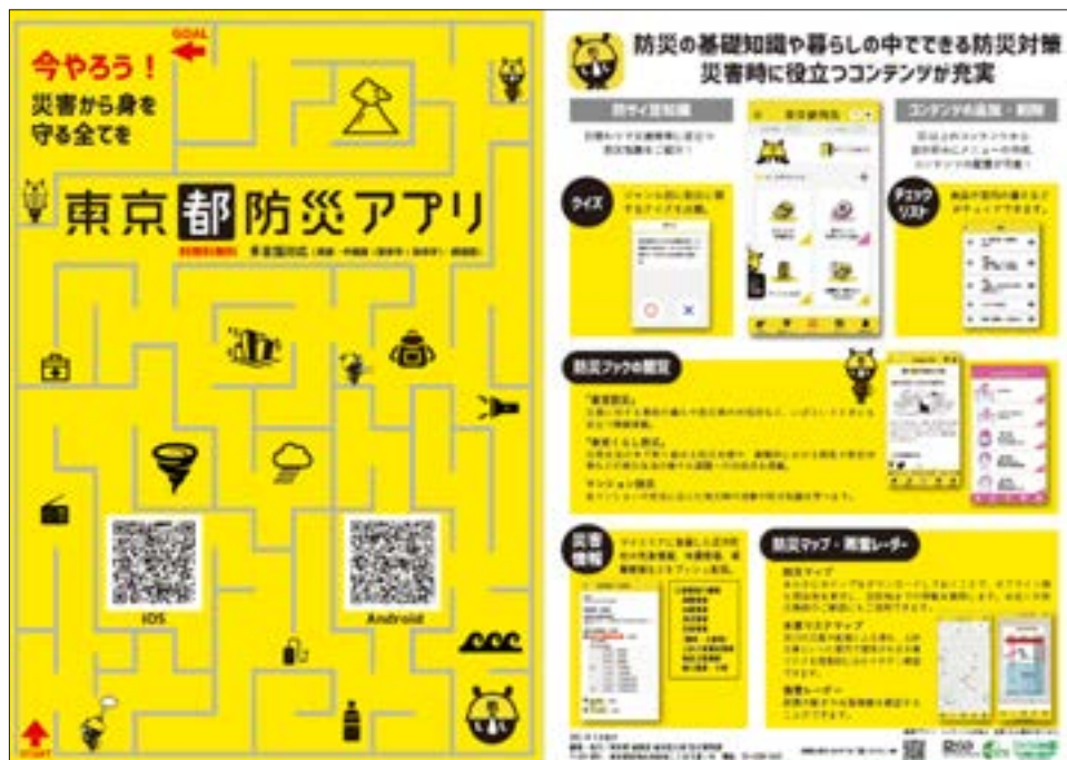
※画面デザイン・コンテンツの内容は変更になる場合があります。