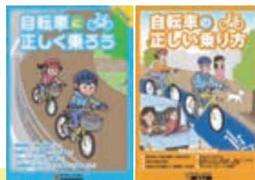
(小学生向け) (中・高校生・一般向け) リーフレット「自転車の正しい乗り方」(警視庁)