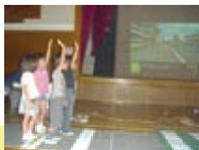
歩行者シミュレータ