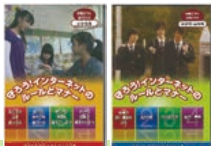
DVD「守ろう！インターネット のルールとマナー」