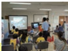
自転車シミュレータ