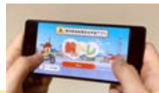
東京都自転車安全学習アプリ 「輪トレ」