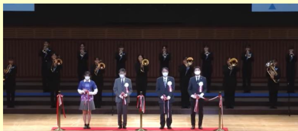
【出発式：東京国際フォーラムホールA】

最後は東京都立井草高等学校による書道パフォーマンスで開会行事を締めくくりました。