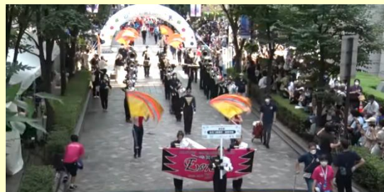
【笑顔があふれたパレード】