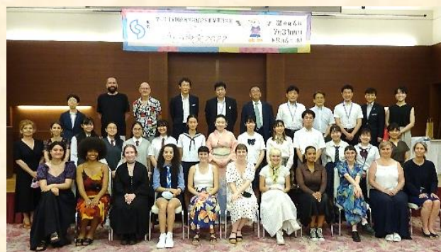
【歓迎レセプション】

歓迎レセプションや交流会では、英語やフランス語でコミュニケーションを図り、日本文化にも興味をもっていただくことができました。