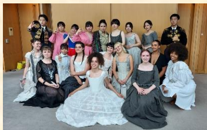
【ポール・ポワレ高校と都立忍岡高校の皆さん】