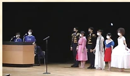
【総合開会式での交歓会】