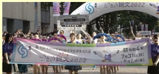
【パレード：丸の内仲通り】