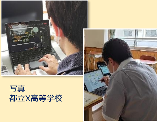
写真 都立X高等学校