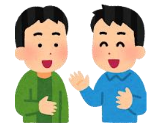
教師同士の会話例