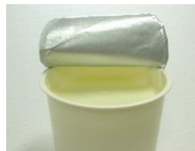
【トーヤル ロータス ® 】