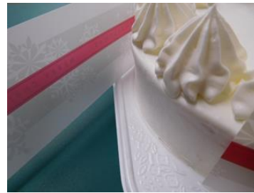
【トーヤル ウルトラロータス ® 】

また、東洋アルミニウム株式会社では、ヨーグルトを振ってもフタにはヨーグルトが付着しないシートを商品開発しており、写真のように一部のヨーグルトで用いられています。