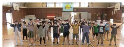
応援動画作成の様子