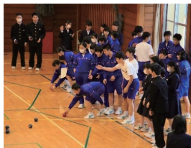
パラスポーツ交流