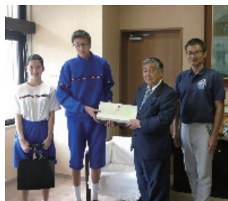
復興を願う募金活動