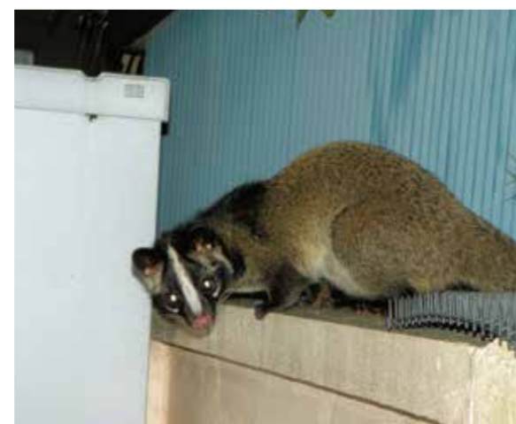
街をはいかいするハクビシン