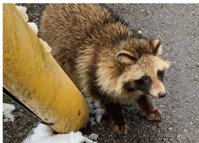
住宅街に出ぼつした野生のタヌキ

道路や工場、住宅などの行き過ぎた開発や手入れ不足で森林や里山が減少しています。自然が失われたことで、そこを住みかにしていた生き物は、食べ物を求めて人里や街に出ぼつするようになりました。