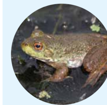
外来種：ウシガエル

外来生物は、もともとその国や地域にいなかったのに、人間によって持ちこまれた生き物で、在来の生き物を食べたり、住みかをうばったりしています。中には、人にひ害をあたえる危険な外来生物もいます。