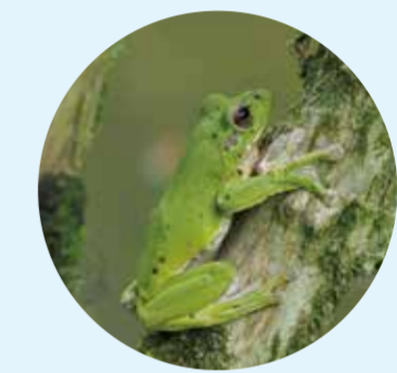
在来種：モリアオガエル