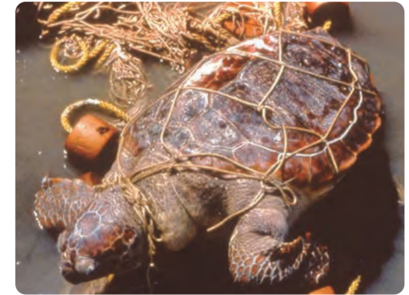
うみ 魚などをとるあみに からだがかからまってしまったウミガメ