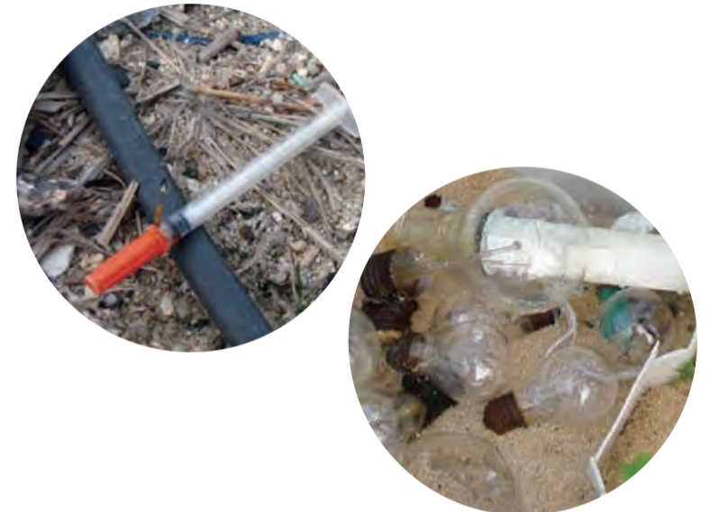
ガラスせいひんなどのごみ