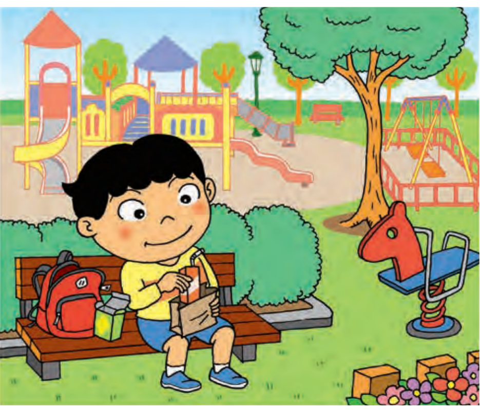
ポイ捨てをしないで、ごみはかならずもちかえろう