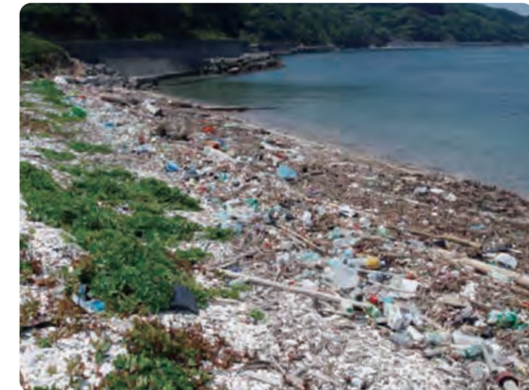
ごみでうめつくされた海がん