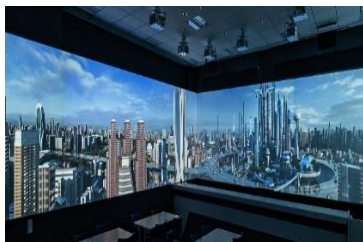
デジタル技術での演出