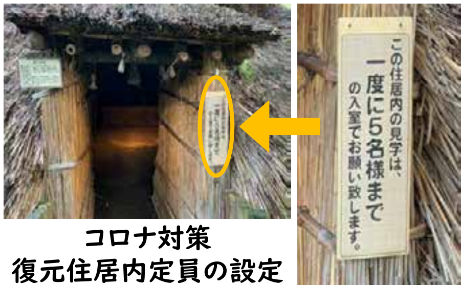
コロナ対策 復元住居内定員の設定