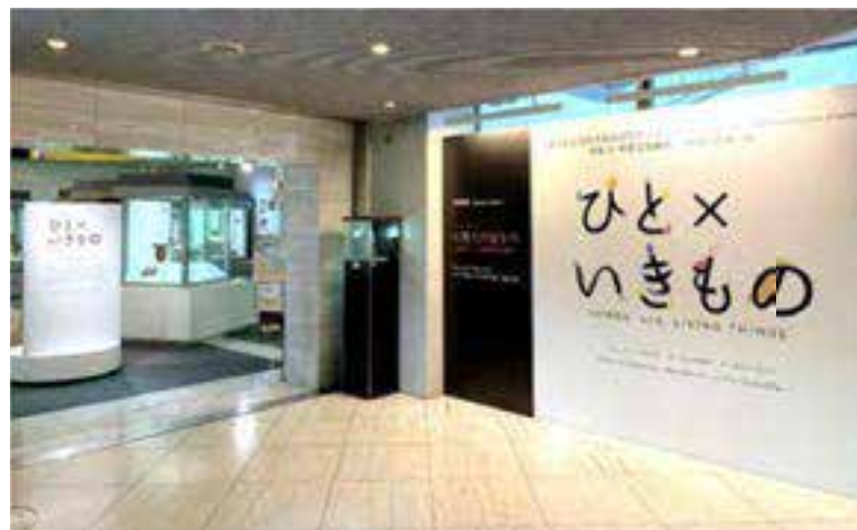
企画展示（令和元年度）