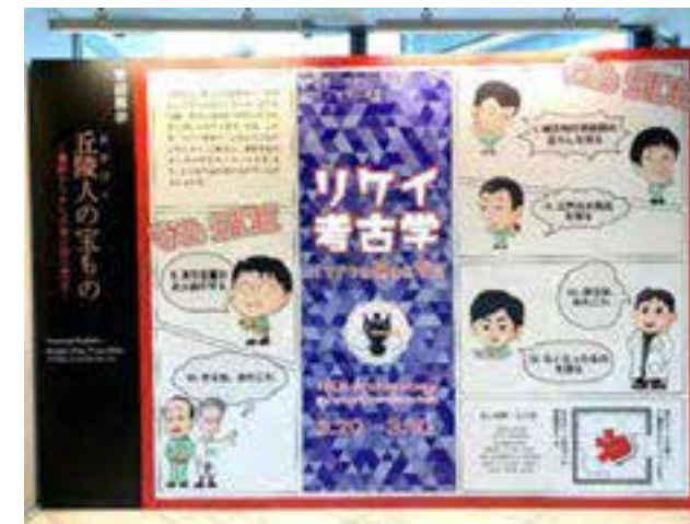
企画展示（令和2年度）