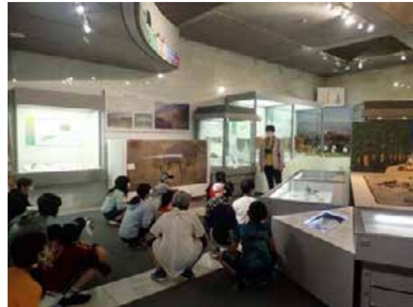
新しい生活様式に則した学校見学