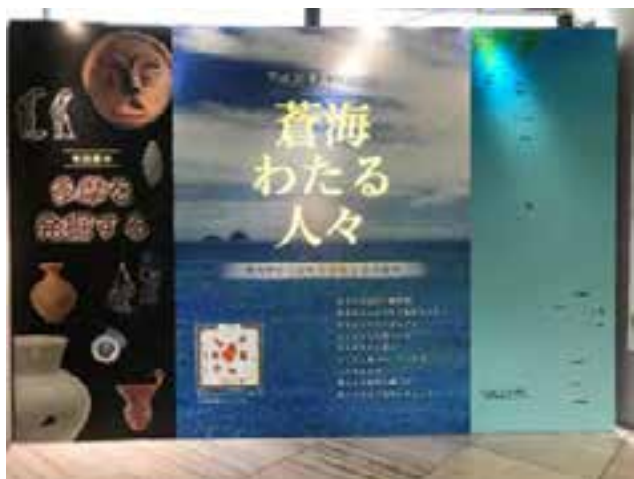
企画展示（平成30年度）