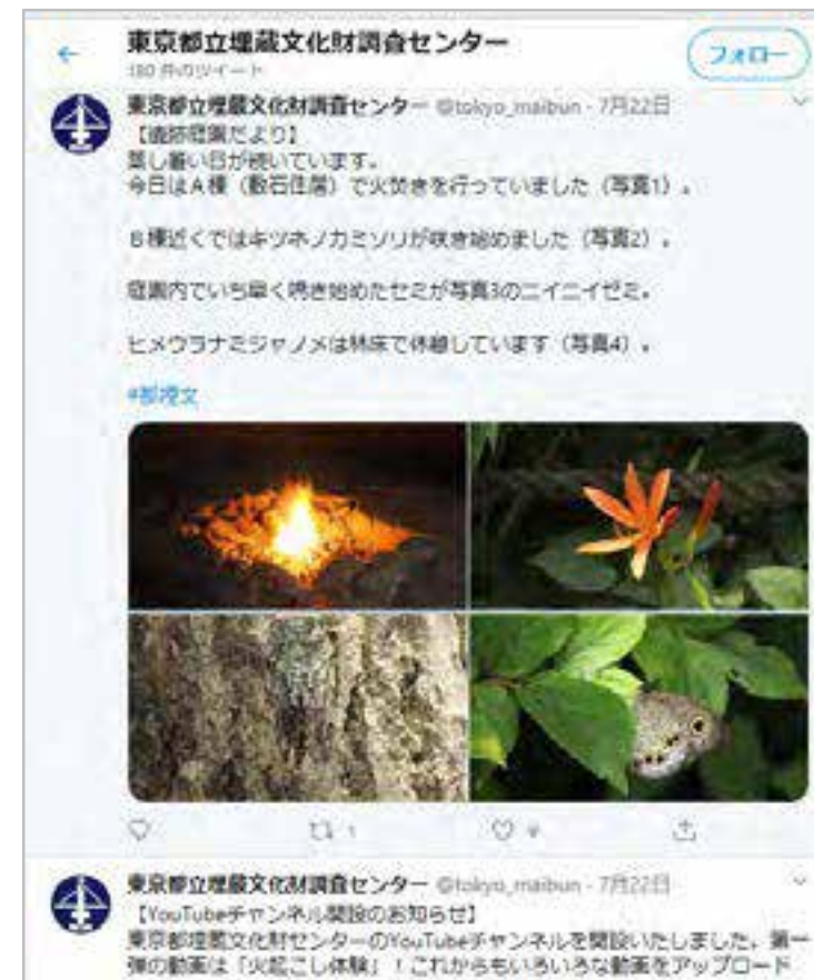
SNSで季節のトピックスを紹介