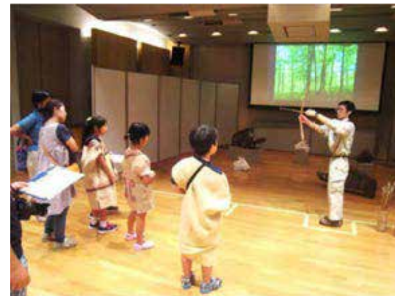
他の区市や近隣県などとの 連携事業