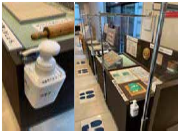
職員自作のコロナ対策