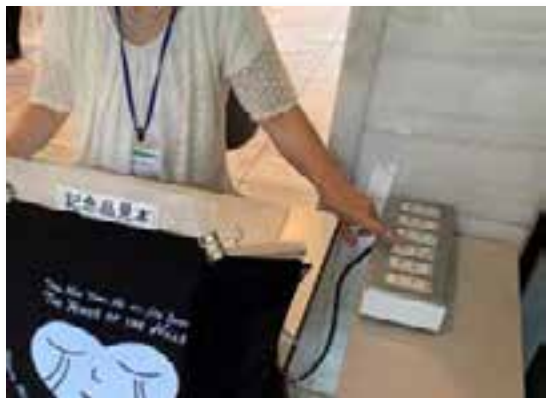
こまめに照明をオン・オフ