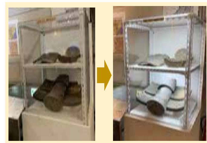
照明装置も職員が自作