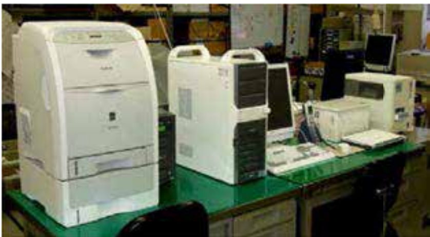
検索管理システム