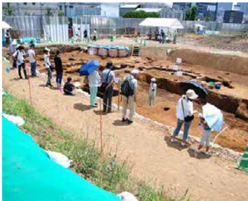
実際の発掘現場をご覧いただく 遺跡見学会