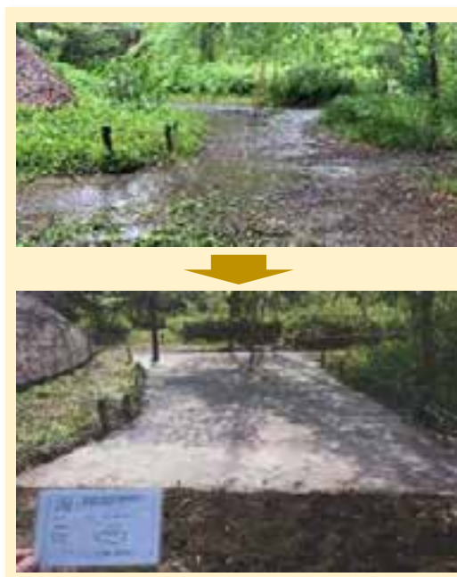
歩きやすいよう 通路の整備