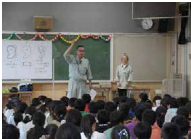
学校のニーズに合わせた 出前授業