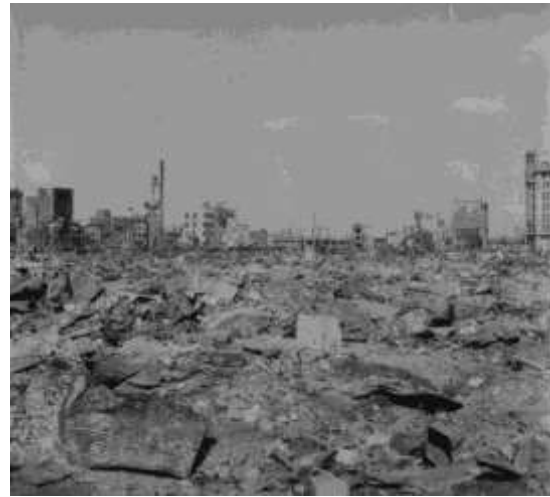
【上野の焼け跡】 (1945年3月19日)

爆撃機は現在の台東区、墨田区、江東区にまたがる約40km 2 の地域に爆弾を投下し、無差別爆撃を行いました。そのため、市街地は火の海と化して、東京は焼け野原となりました。