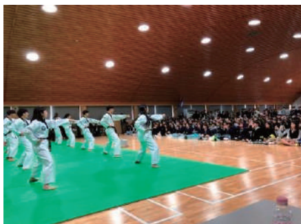
<韓国修学旅行（学校間交流）>