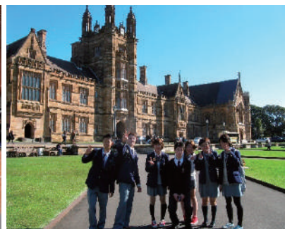
<オーストラリア研修旅行>