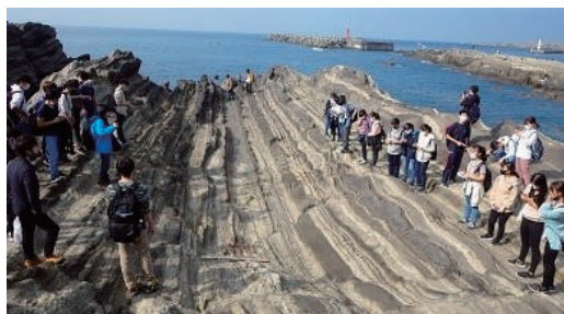
＜城ヶ島でのフィールドワーク＞