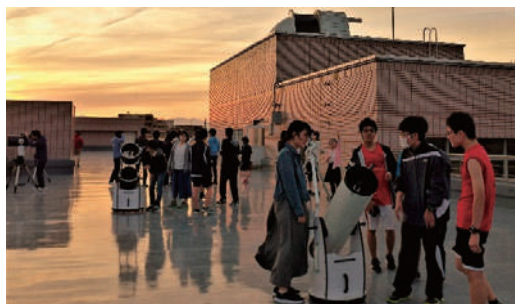
＜屋上での天体観望会＞