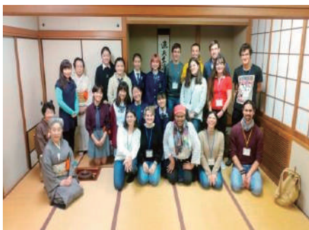
<フランス提携校の受け入れ>