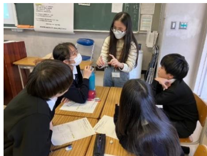
都立高校での授業参加体験・グループディスカッション