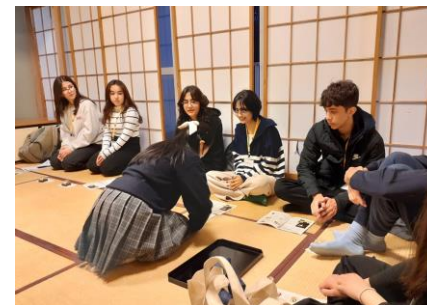
日本文化体験（弓道・茶道）