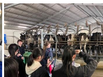
ニュージーランド