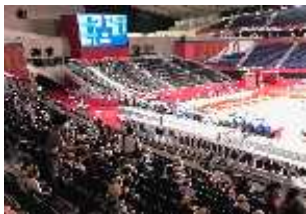
組織委員会や各家庭と安全 対策を講じ実施した競技観戦