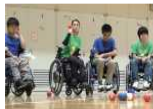
パラ競技団体や近隣学校 と連携したパラスポーツ交流