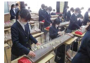
芸術・文化団体と 連携した音楽体験