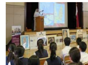
在京大使館や国際交流 団体と連携した交流体験