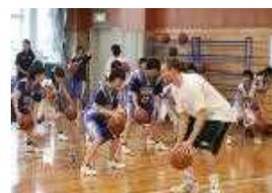
トップアスリートによる 講演・体験教室