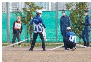
自治体や家庭と連携し、防 災訓練等の地域行事参加