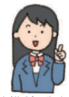
ちゅうがっこう せいと 中学校の生徒

かいしゃ はたら かくしゅう がっこう 会社で働くための学習ができる学校は、 しょうらい ほんとう やくだ おも 将来のために本当に役立つと思うので、 ふ ぜひ増やしてください。