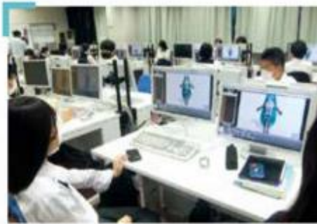
コンピュータグラフィックス